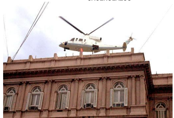
HUIDA DE LA RUA EN HELICÓPTERO