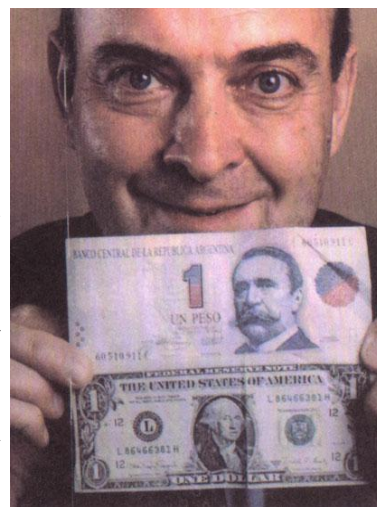
PLAN DE CONVERTIBILIDAD DOMINGO CAVALLO