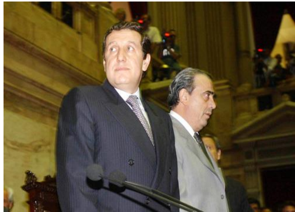
ING. RAÚL PUERTA PRESIDENTE DEL SENADO

año 2001; el retiro masivo de grandes capitales en dólares, hacia el exterior, hicieron que el gobierno tome medidas a los efectos de evitar que todos los ahorristas sigan ese camino. La medida en cuestión fue bloquear las cajas de ahorros, plazos fijos, cuentas bancarias en sueldos etc.. El bloqueo consistiría en que las extracciones se harían por montos determinados, $250, por semana, esta medida económica se la denominó "El Corralito Financiero". Las protestas no se hicieron esperar, y por primera vez en muchos años, ciudadanos de diferentes clases sociales, se comenzaron a auto convocar en las calles, manifestando su disconformidad con la medida tomada. De esas protestas nace una nueva modalidad de manifestación popular, "El Cacerolazo".