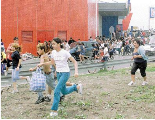
"LOS SAQUEOS A SUPERMERCADOS"

Con la derrota electoral sufrida el 14 de octubre de 2001, y habiendo mayoría por parte del Partido Justicialista en el Senado, se designa como presidente de la misma al representante por la provincia de Misiones,