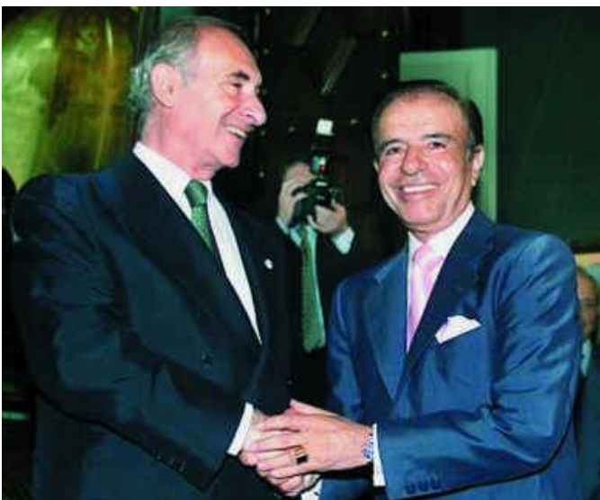
APOYO DE MENEM CONTINUIDAD PLAN ECONÓMICO

la denuncia de sobornos en el Senado de la Nación Argentina para sanción de la "Ley de Reforma Laboral". La denuncia en cuestión termino con una declaración de falta de mérito para los imputados. En medio de esa problemática y ante enfrentamientos reiterados entre los integrantes de la formula presidencial, el 6 de octubre de 2000, sorpresivamente y en conferencia de prensa Carlos Alvarez renuncia a la Vicepresidencia de la Nación, la cual fue calificada por parte de los diferentes analistas políticos como el derrumbe de la Alianza , vaticinando el fracaso del gobierno de Fernando De la Rúa . Ante esta situación y de inmediato, De la Rúa efectúa un anuncio "el pueblo nos eligió, hay que cumplir hasta el final los mandatos". Con el correr de las horas , comienzan las renuncias de ministros y demás integrantes del gabinete presidencial que pertenecían al Frepaso, haciendo que De la Rúa reestructure todo su gabinete. Con la Alianza destruida, la continuidad del gobierno sería en su gran mayoría con hombres del Radicalismo .