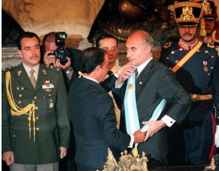
PASO DE MANDO MENEM - DE LA RUA

Como primera medida de gobierno se sanciona la Reforma Laboral. Posteriormente, y ante el déficit fiscal, establece por decreto de necesidad y urgencia una drástica reducción en los sueldos de la administración pública nacional, que luego alcanzaría a las jubilaciones. De allí en más La Alianza electoral integrada en su gran mayoría por el Partido Radical, comenzaría a resquebrajarse, debido al desentendimiento que reinaba con los referentes del Frente País Solidario "FREPASO". El punto más importante de la ruptura, fue