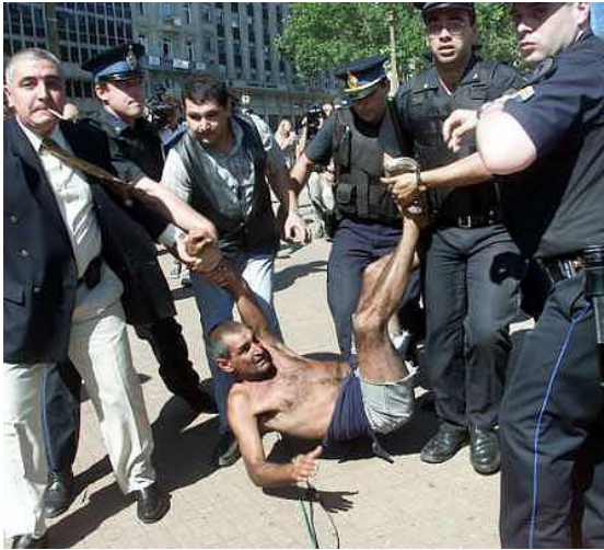
INCIDENTES PLAZA DE MAYO

comunes en todos los casos, “La falta de conducción política, que no es otra cosa que falta de unión nacional, y los problemas económicos, que aparecen y desaparecen como tormentas tropicales, en su gran mayoría orquestados de una u otra forma”. El 21-12-01, la Asamblea legislativa aceptó la renuncia de Fernando De la Rúa, quedando en el cargo interinamente y por el término de 48 horas el senador por la Provincia de Misiones y Presidente de la Cámara del Senado, Ingeniero Raúl Puerta , del Partido Justicialista.